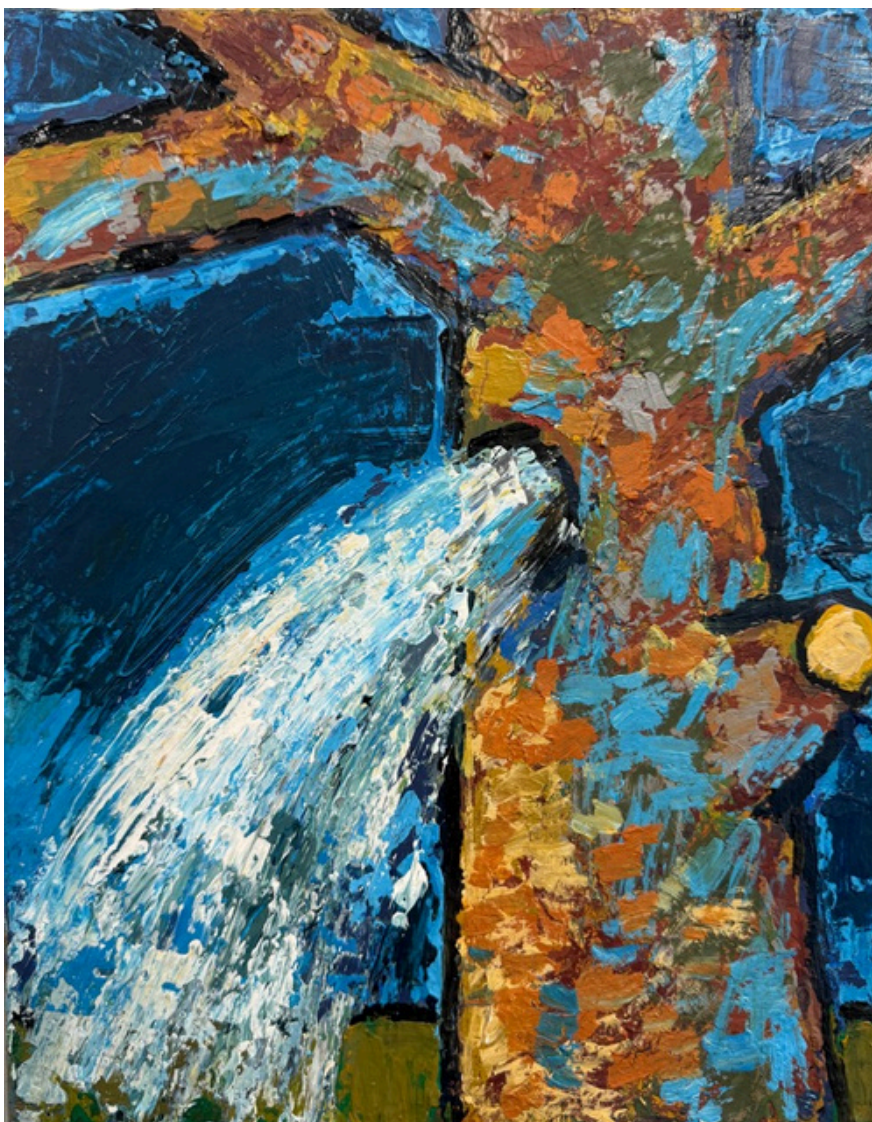
11. Hubert Bujak, Fountain, akryl na płótnie, 30x24 cm, 2021