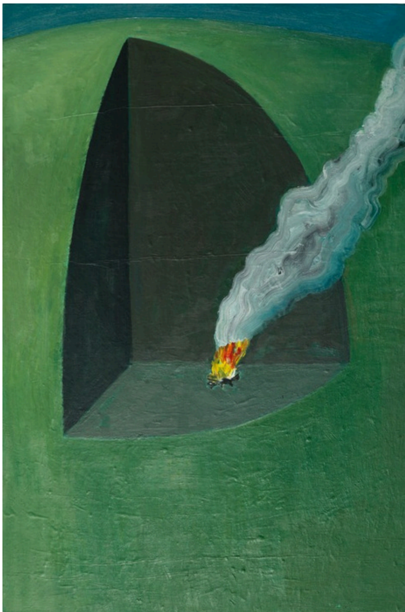
5. Hubert Bujak, Ognisko, olej na płótnie, 90x60 cm, 2026