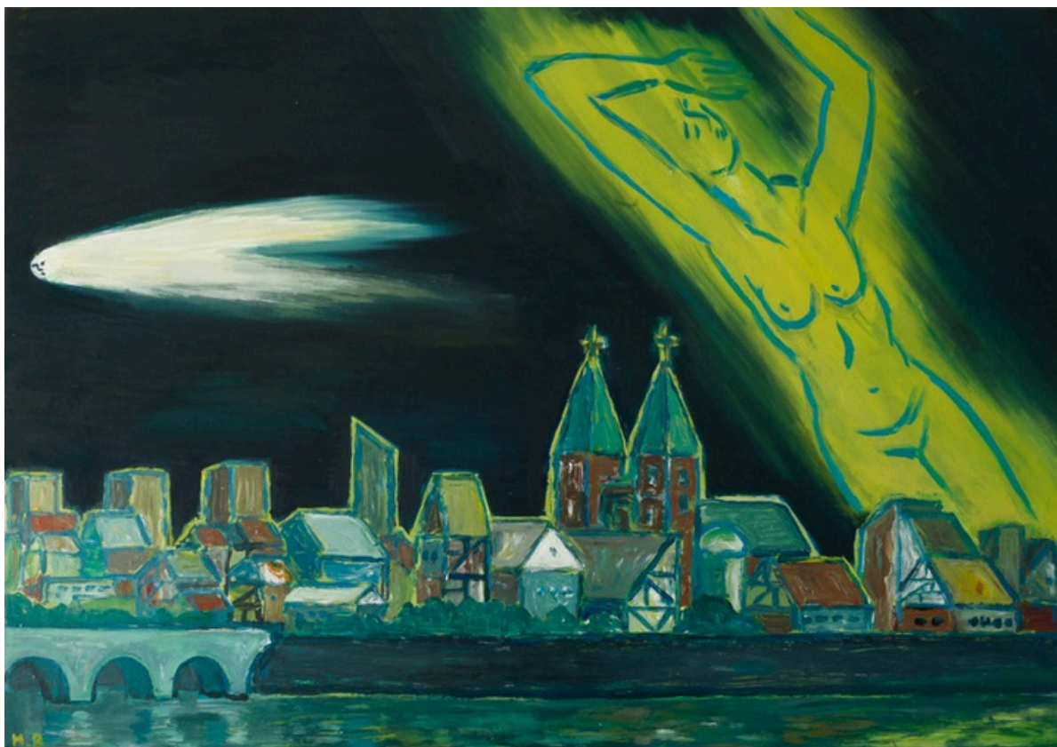
3.Hubert Bujak, Zorza polarna i kometa nad miastem, olej i akryl na płótnie, 70x100cm, 2025