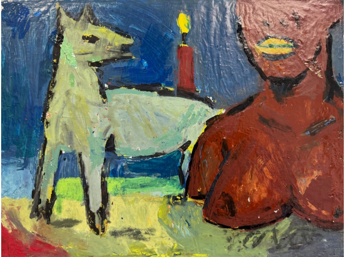
10. Hubert Bujak, Świczka, akryl na płótnie, 30x40 cm, 2023