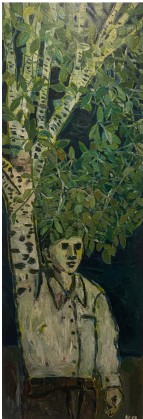
7. Hubert Bujak, Brzoza, olej, akryl na płótnie, 140x50 cm, 2025