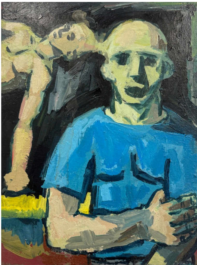
9. Hubert Bujak, Połączenia, akryl na płótnie, 40x30 cm, 2021