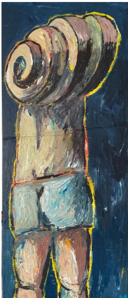
8. Hubert Bujak, Dekadencja, akryl na płótnie,, 120x50cm, 2025