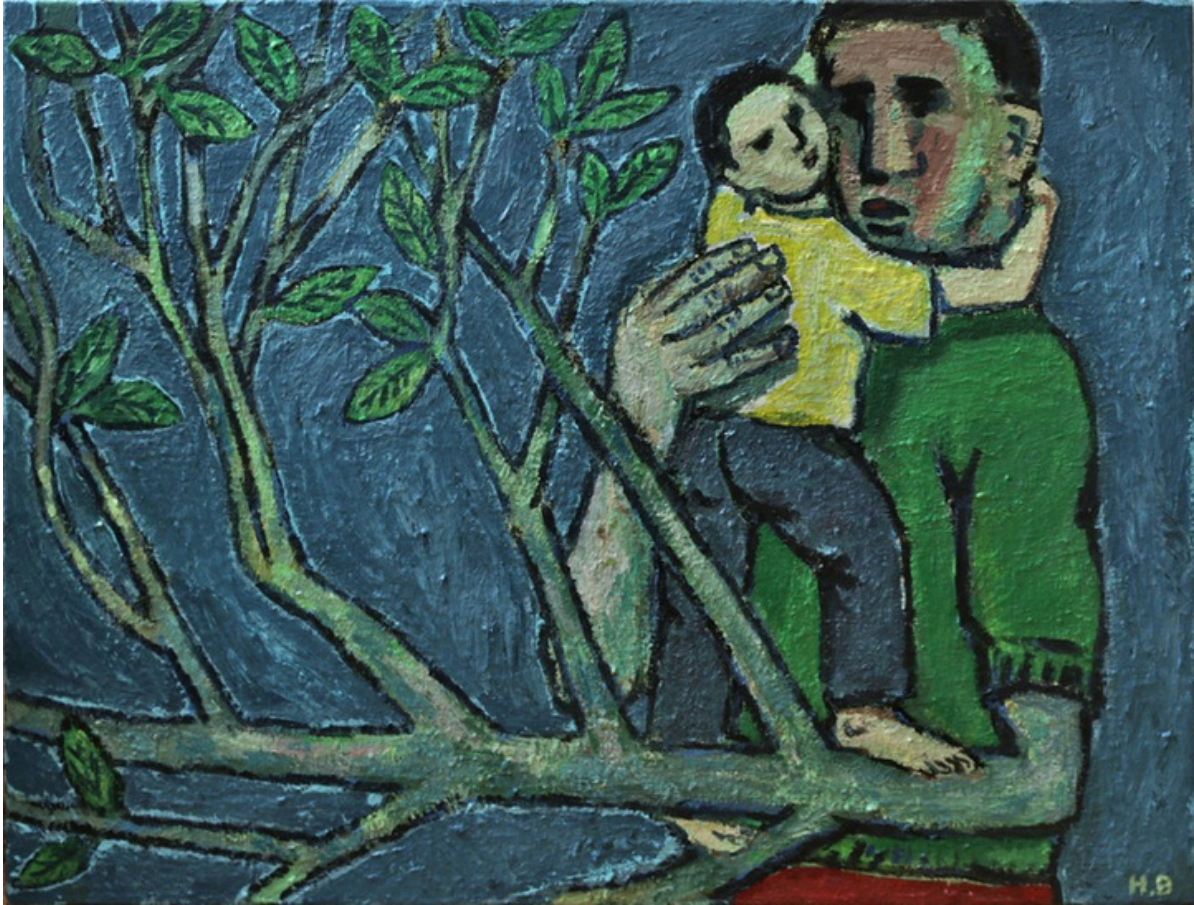
2. Hubert Bujak, Wspinam się po drzewie, akryl, płótno, 60x80cm, 2025