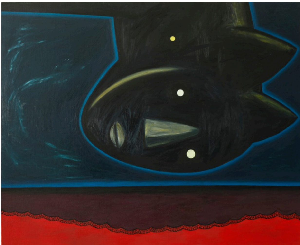
6. Hubert Bujak, Koniunkcja, olej, płótno, 110x140 cm, 2026