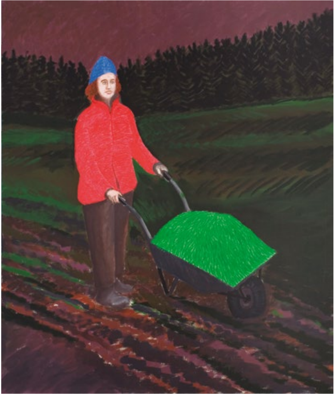
Regina tempera żółtkowa na płótnie, 160cm x 135cm, 2015