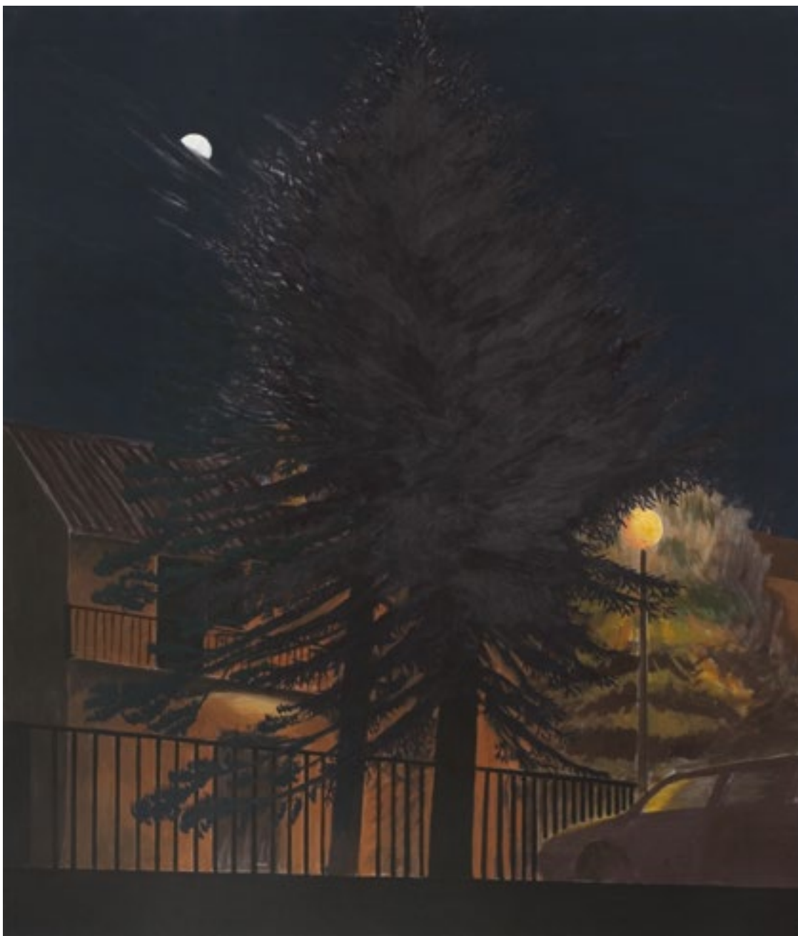
Urania tempera żółtkowa na płótnie, 160cm x 135cm, 2015