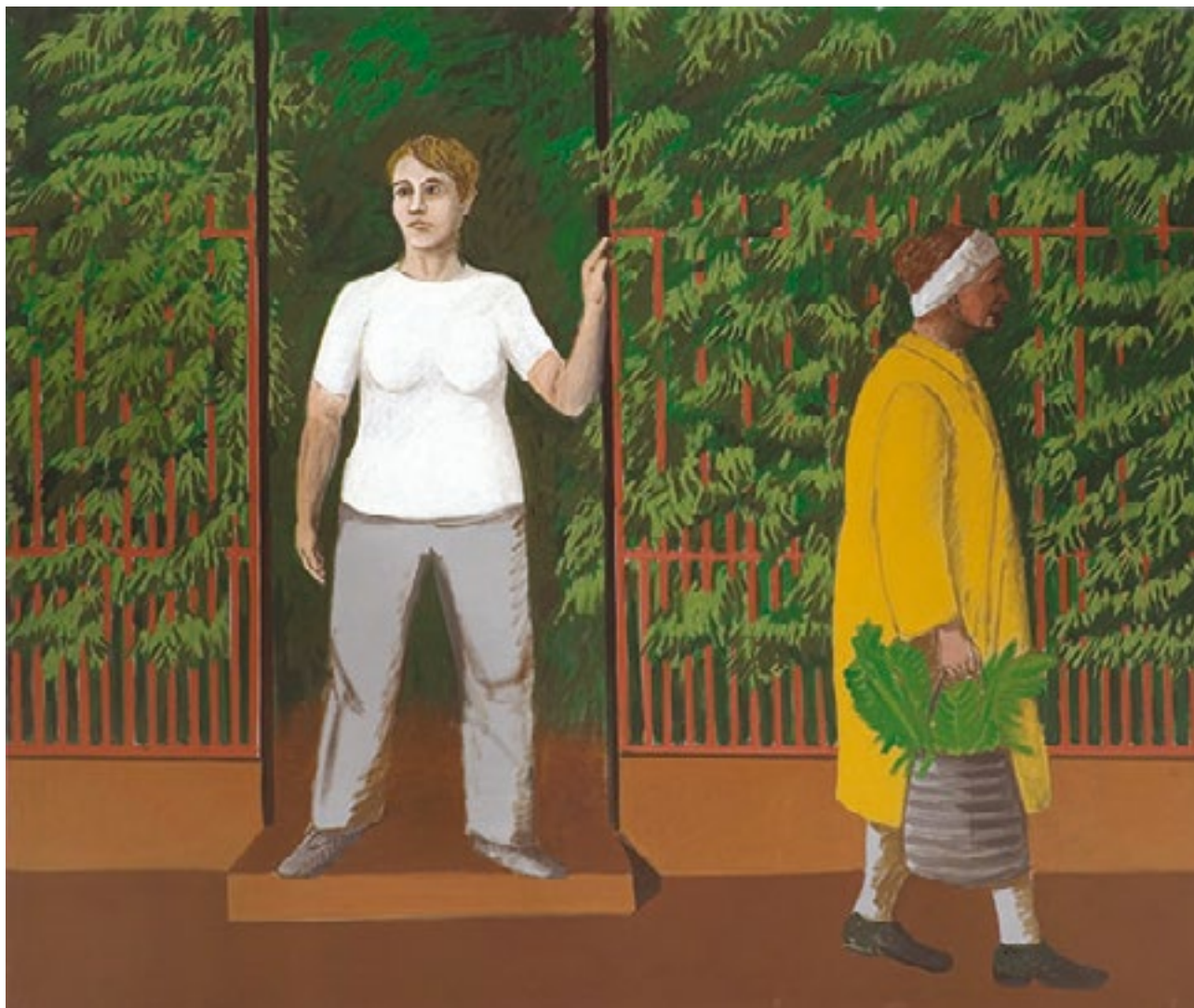
Starsze panie przed swoimi ogródkami tempera żółtkowa na płótnie, 135cm x 160cm, 2015